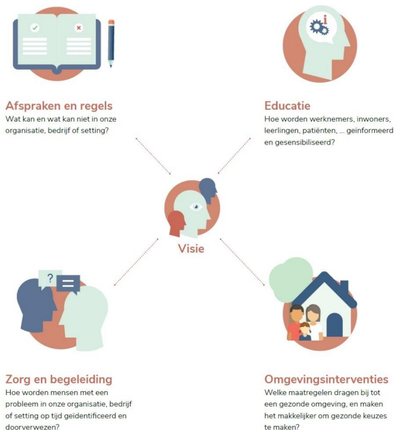
Schema: de vier pijlers van een alcohol- en drugbeleid (VAD)

Binnen een organisatie zijn al deze initiatieven onderdeel van het alcohol- en drugbeleid. Vertrekkend vanuit de visie van jouw organisatie kan je met behulp van de VAD-methodieken en materialen de vier pijlers op maat van jouw organisatie verder uitbouwen.