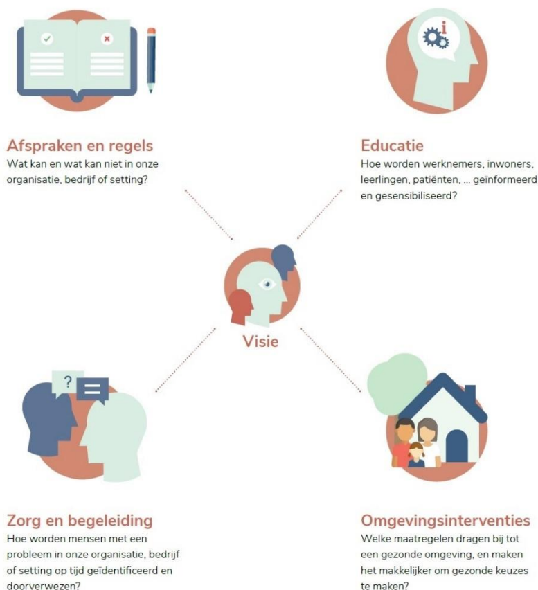
Schema: de vier pijlers van een alcohol- en drugbeleid (VAD)

Het uitwerken van een alcohol- en drugbeleid is een effectieve manier om in het jeugdwerk problemen door middelengebruik te voorkomen en er mee aan de slag te gaan. In een alcohol- en drugbeleid leg je vast wat er in jouw werking kan en niet kan met betrekking tot middelengebruik, hoe er preventief gewerkt wordt, welke plaats middelengebruik krijgt en hoe jullie werking de kans op problemen zo klein mogelijk maken. Onderstaande methodieken van VAD kunnen jullie gebruiken om een alcohol- en drugbeleid uit te werken en de vier pijlers vorm te geven.