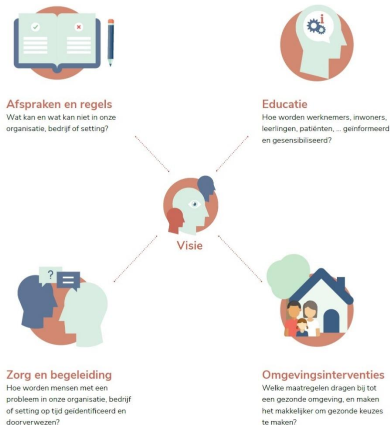
Schema: de vier pijlers van een alcohol- en drugbeleid (VAD)

Tijdens een evenement zijn al deze initiatieven onderdeel van het alcohol- en drugbeleid. Vertrekkend vanuit de visie van jouw organisatie kan je met behulp van de VAD-methodieken en materialen de vier pijlers op maat van jouw organisatie verder uitbouwen.