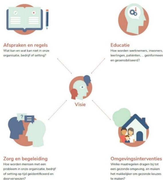
Schema: de vier pijlers van een alcohol- en drugbeleid (VAD)

De nood aan ondersteuning voor gezinnen is verschillend. Afhankelijk van de ernst van de vragen of zorgen is een specifiek aanbod beschikbaar, te plaatsen op het interventiecontinuüm van preventie voor ouders van jonge kinderen tot en met hulpverlening voor ouders van kinderen die problematisch gebruiken.