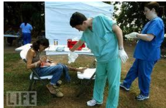
Onofficiële DCR in Porto Rico